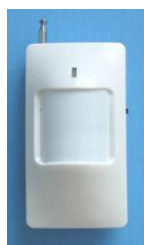
Инфракрасный датчик движения (беспроводной)