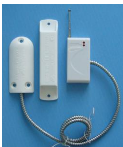
ИО 102-26 «ЗМЕЯ» (беспроводной)