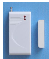
Магнитоконтактный датчик (беспроводной)