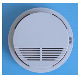
Дымовой датчик (беспроводной)