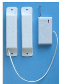
ИО 102-26 «АЯКС» (беспроводной)