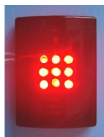
Оповещатель световой ОI2-4 "ИСКРА"