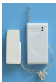
Датчик разбития стекла «ДИМК» (беспроводной)