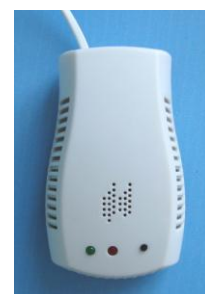
Датчик утечки газа (беспроводной)