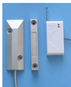
Датчик для рулонных ворот (беспроводной)