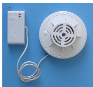
ИП 105-1-(-50°C) «ЛОТОС» (беспроводной)