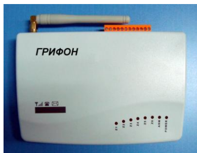
Центральный блок охранной системы Грифон GSM

ООО НПП «Магнито-Контакт» имеет большой ассортимент датчиков и охранных извещателей, что позволяет реализовать различные задачи по охране помещений. Датчики и извещатели могут подключаться, как при помощи провода непосредственно к центральному блоку, так и использоваться в качестве беспроводных (совместно с блоком радиопередатчика). Таким образом, благодаря использованию блока радиопередатчика, пользователь может установить датчики практически в любом месте: на сейфе, ящике стола и других местах, где проблематично установление проводных датчиков.