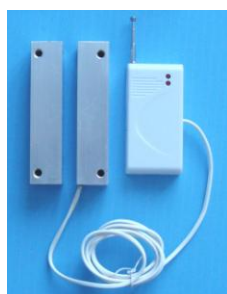
ДПМ-2 «МЕТАЛЛ» (беспроводной)