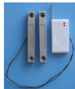
Дверной датчик (беспроводной)